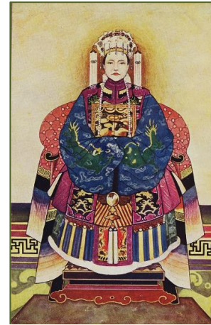
Китайская императрица на троне из «Детской энциклопедии» И.Д. Сытина