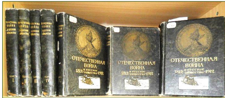
Юбилейное семитомное энциклопедическое издание И.Д. Сытина «Отечественная война и русское общество. 1812 – 1912»