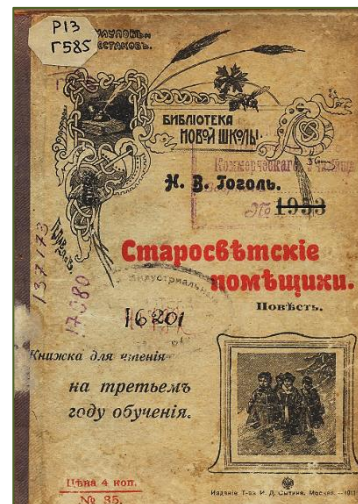
Издание И.Д. Сытина «Старосветские помещики» из «Библиотеки Новой школы»

На выставках в читальном зале редких изданий (специально развернутых для студентов – будущих издателей, с целью аналитики технических особенностей книг) представлены раритеты издательства И.Д. Сытина: среди них повесть Н.В. Гоголя