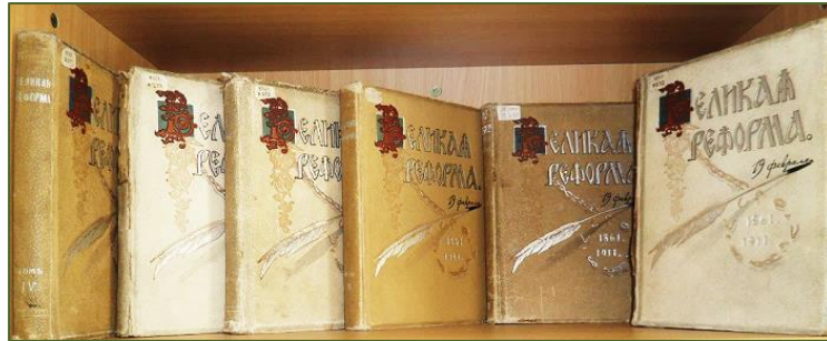
Сувенирные энциклопедии И. Д. Сытина «Великая реформа 19 февраля 1861 – 1911»

подобных книг сам издатель относился очень серьёзно и ответственно. Привлекал к работе над выпуском известных историков, художников, гравёров, этнографов, просветителей, писателей и поэтов, литературных критиков. Научное руководство формированием контента энциклопедии осуществляли товарищество И.Д. Сытина и негосударственная, просветительская и педагогическая общественная организация – Историческая комиссия учебного отдела московского О. Р. Т. З., созданная в 1869 году. Редакционную коллегию «Великой реформы» возглавили выпускники историко-филологического факультета Московского университета, общественные деятели Исторической комиссии учебного отдела О. Р. Т. З. – историк, искусствовед и энциклопедист Алексей Карпович (Карапетович) Дживелегов (1875 – 1952), историк Сергей Петрович Мельгунов (1880–1956), историк Владимир Иванович Пичета (1878 – 1947). По замечаниям редакции, в данном издании предпринята «попытка выяснить историческое значение события 19 февраля 1861 года во всём объёме, на фоне истории русского крестьянства и русской общественной эволюции» [3, с. IV]. В издании приняли участие более 60 профессоров, приват-доцентов, писателей и педагогов [10, с. 96].